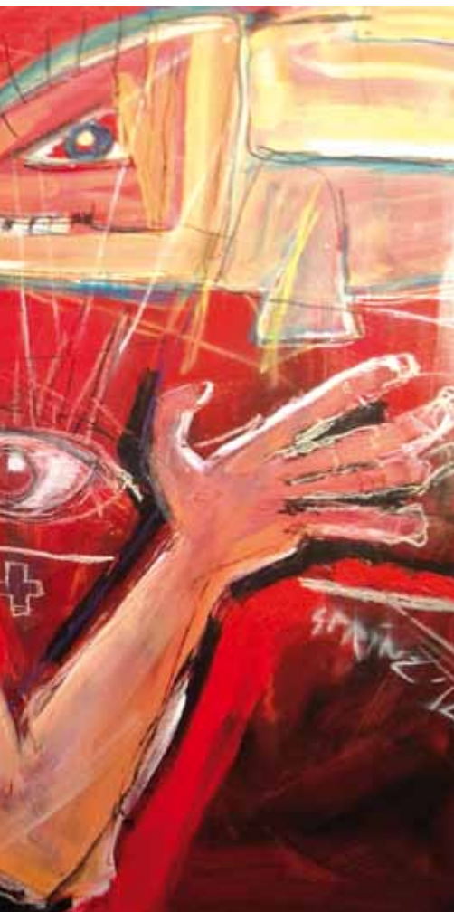
„King Torro in Paradise I“