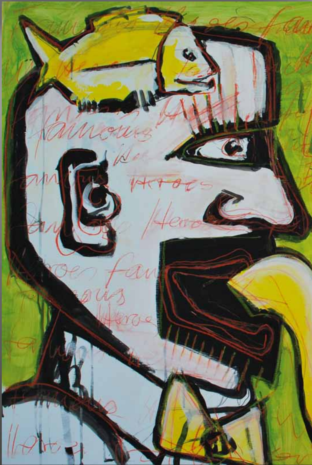
Famous Heroes „Dialog III“