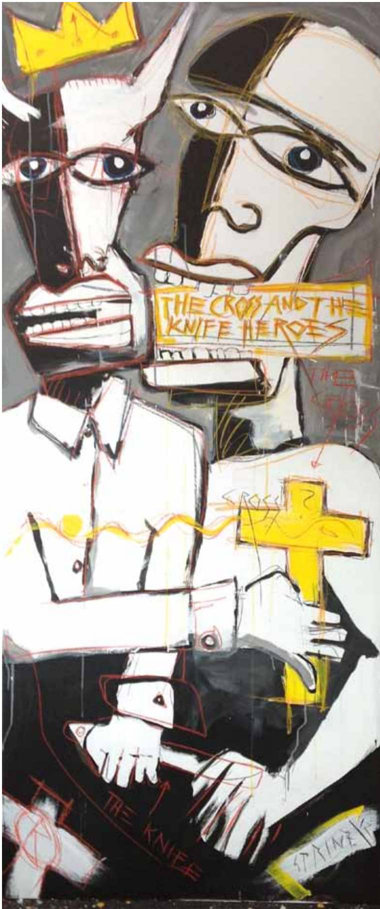
„The cross and the knife heroes“