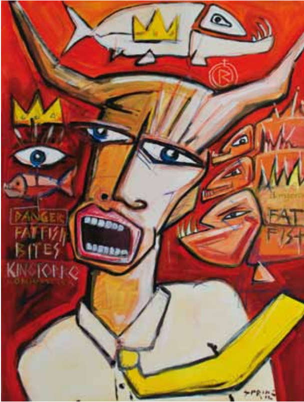
„Fat fish bites King Torro“