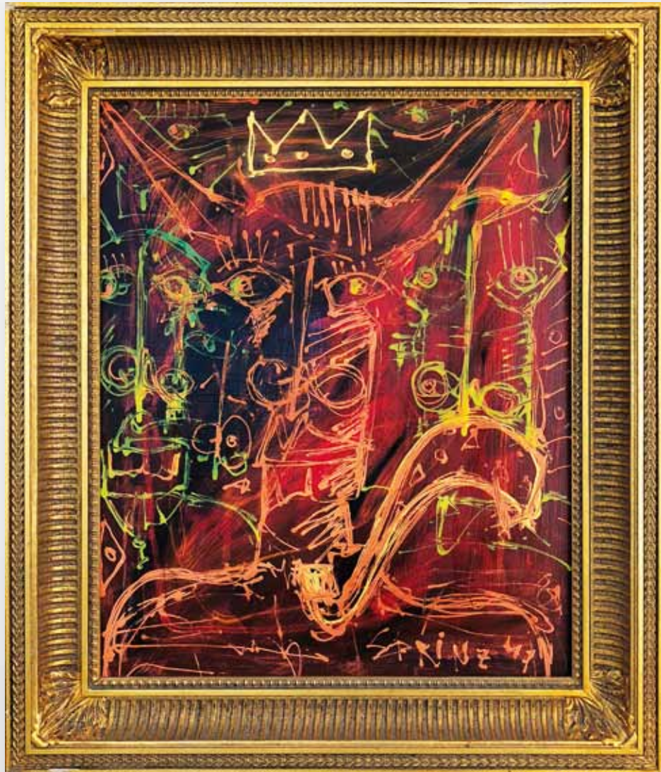
Famous Heroes „Königstier“