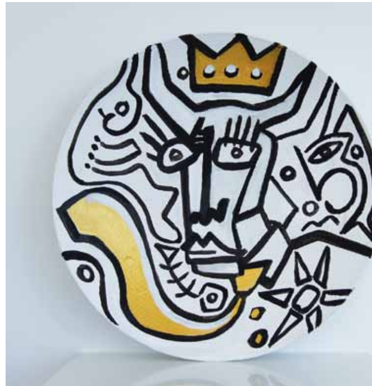
S c h a l e n : Handbemalte Unikate auf Bambus oder Holz ...