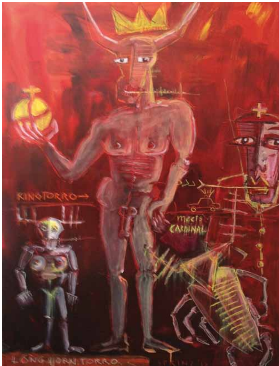
„King Torro meets Cardinal“